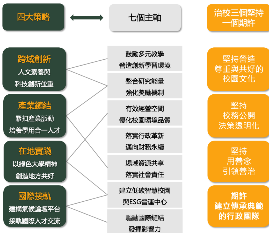
四大發展策略與七大主軸